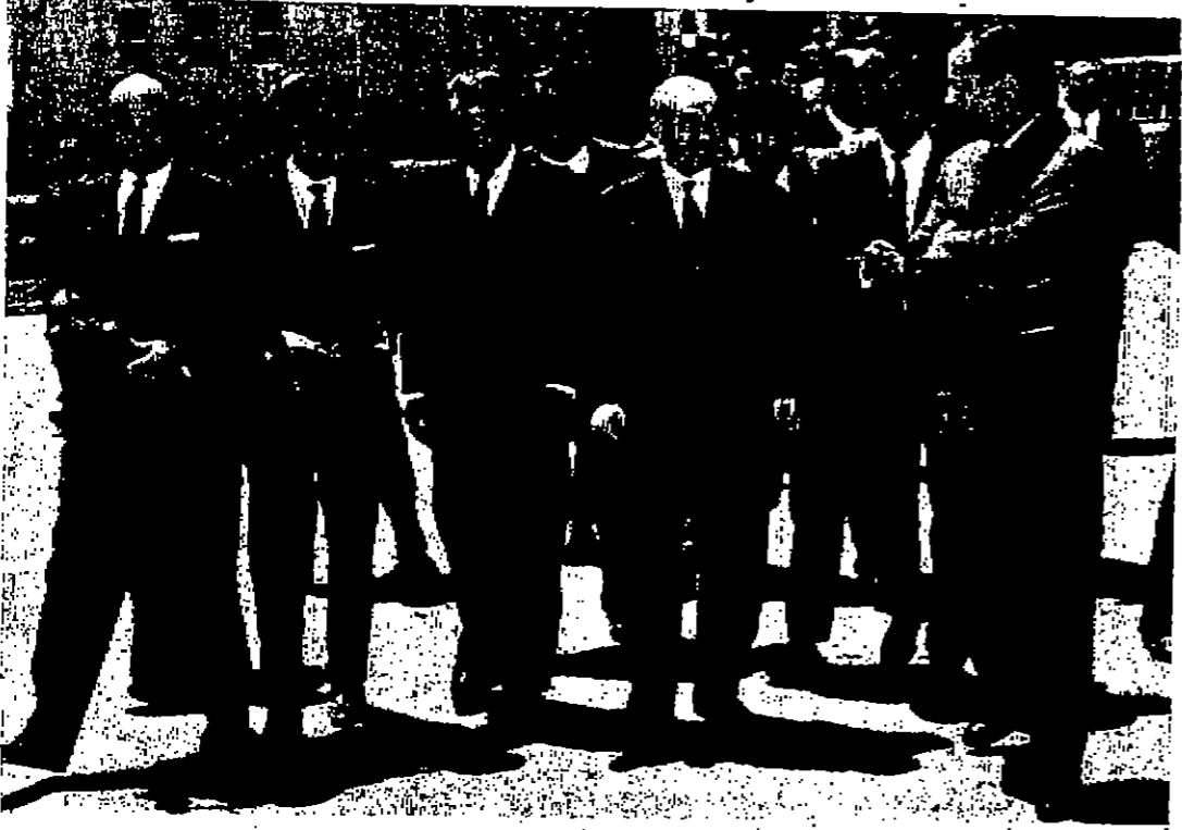
السيد بهجت التلهوني رئيس الوزراء الذي سافر إلى القاهرة أمس وحوله بعض الوزراء ورجال الصحافة

بعمارة في ٢ صفر سنة ١٣٨٨ هـ الموافق ١ أيار سنة ١٩٦٨ م رقم العدد ٢٨٠ AD-DUSTOOR - ARABIC DAILY NEWSPAPER AMMAN WEDNESDAY 1/5/1968 No : 380